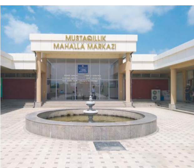
После Зарбдарского района начинается территория города Даштабада, а дальше – Заамин. Вся дорога

между мной и уже немолодым таксистом шла непринуждённая беседа.